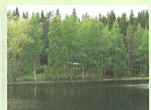
写真4 郊外の湖畔の別荘