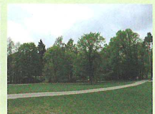
写真2 ヘルシンキ市内の森林公園