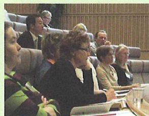
写真1 熱心に聴き入るフィンランドの聴衆（高山氏撮影）

ところで、フィンランドでは今回初めて森林の医学効果の実験を行います。都市内の森林と、郊外の森林と都市環境を比較する予定です。フィンランド国民は日常的に森林レクリエーションに親しんでおり、都市内の森林公園（写真2）や郊外の規模の大きい森林公園、国立公園（写真3）など森林内トレイルも整備されています。そして、1ヶ月半の長期に及ぶ夏休みには、湖畔の別荘（写真4）で滞在するのがフィンランド人のライフスタイルになっています。このように、我が国と並ぶ世界の森林国において、森林セラピーがどのように人に効果があるのか大変興味深いところです。