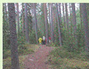
写真3 ヘルシンキ郊外の国立公園